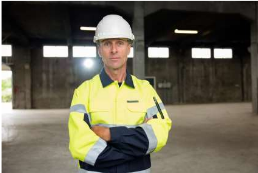
Figuur 4 Een PWG-product dat is vervaardigd van Fairtrade biokatoen en gerecycled polyester.

omdat er geen nieuwe polyester geproduceerd hoeft te worden – er zijn dus minder niet-hernieuwbare grondstoffen nodig voor de productie.